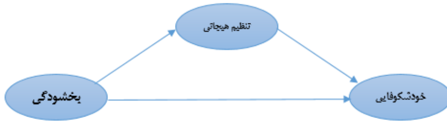
شکل ۱: مدل نظری رابطه‌ی بین «بخشودگی» و «خوشکوفایی» با میانجی‌گری «تنظیم هیجانی»

پس از رسم ساختار بالا در نرم‌افزار LISREL، اضافه نمودن قیود مدل و انتخاب روش ماکسیمم درست‌نمایی، مدل اجرا شده و نمودار مسیر برازش شکل ۲ و مقادیر مربوط به t در شکل ۳ به دست آمد: